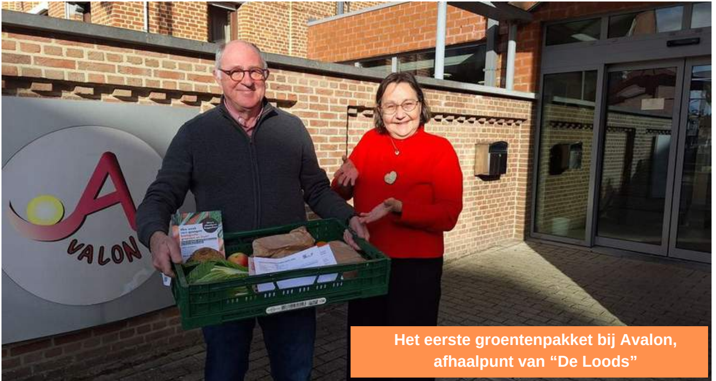
Het eerste groentepakket bij Avalon, afhaalpunt van "De Loods"