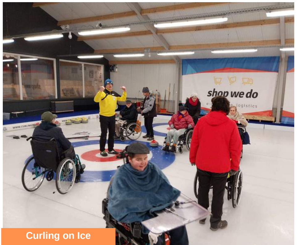
Curling on Ice