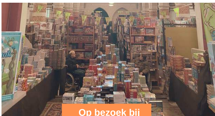
Op bezoek bij de "Puzzelman"